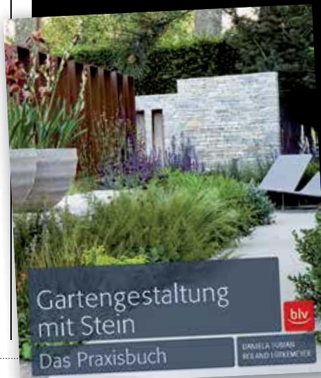
Gartengestaltung mit Stein Das Praxisbuch

Daniela Toman/Roland Lütkemeyer: »Gartengestaltung mit Steinen«, Neuerscheinung September 2012, gebundene Ausgabe 228 Seiten, Preis 29,95, BLV Buchverlag, München, ISBN-10: 3835409786, ISBN-13: 978-3835409781